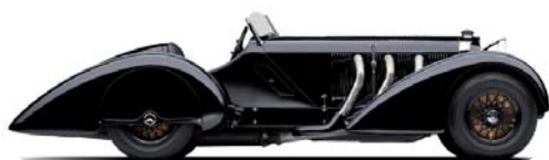
La Mercedes SSK-1930

C'est l'un des événements les plus attendus de l'année 2011. Autour du thème "L'Art de l'automobile",