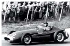
Juan Manuel Fangio

Bien entendu, comme chaque année, vous y retrouverez sur leur stand les collaborateurs de LDA Classic Car.